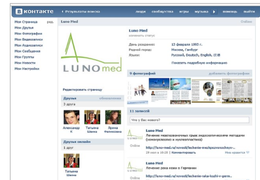
Social Network - vkontakte